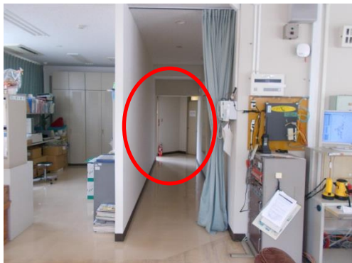
奥に被覆室があります。