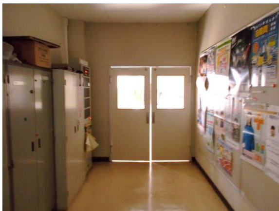
利賀市民センター入り口